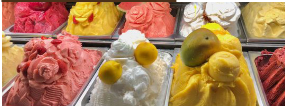
Gelato die Natura ITALIANO IL MANTECATO ARTIGIANALE